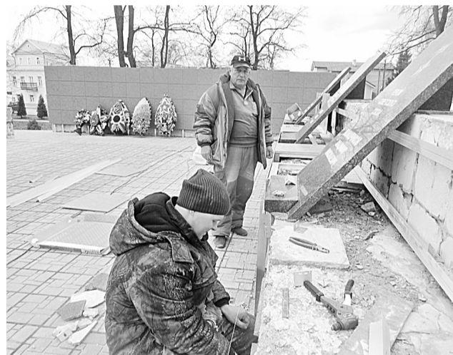
Идёт реконструкция мемориала «Вечный огонь»

«Вечный огонь»). Работает также ООО «Мосгидроспецстрой». Сейчас ведётся ремонт мемориального комплекса (замена букв, ремонт штукатурки, вентилируемый фасад, замена гранитных информационных досок), планируется посадить деревья, установить арт-объект. Работы должны быть завершены до 1 мая. Второй этап благоустройства парка Победы будет вынесен