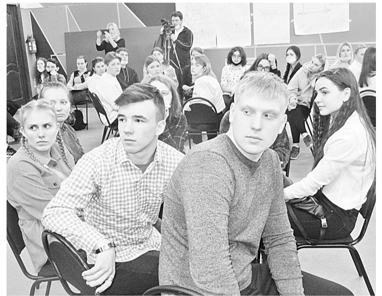
Команда Ёгольской школы